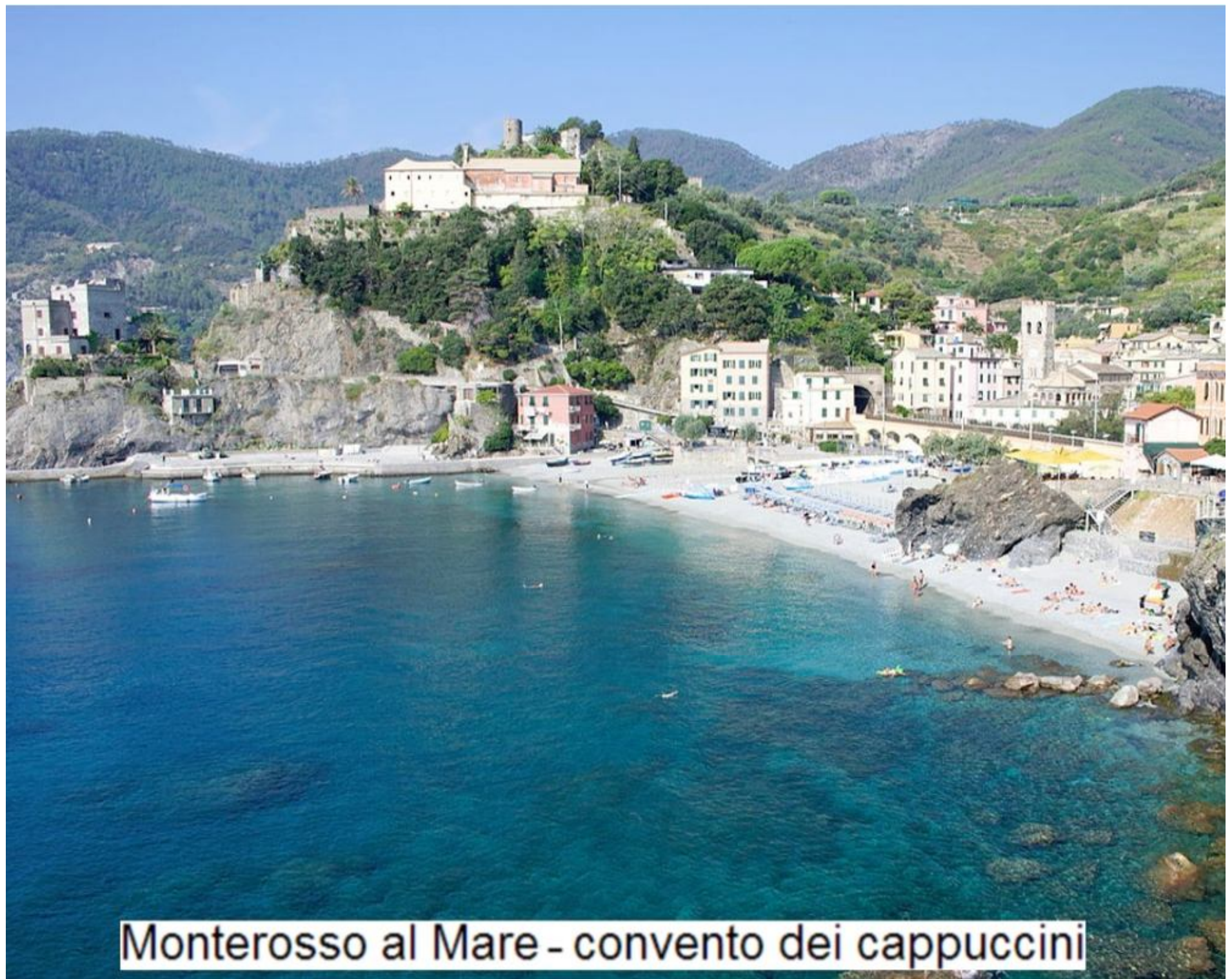
Monterosso al Mare - convento dei cappuccini